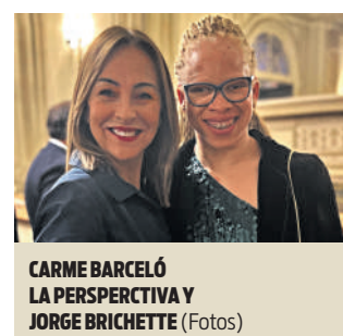
CARME BARCELÓ LA PERSPECTIVA Y JORGE BRICHETTE (FOTOS)

C orrer sin ver y ganar. Huir de tu país y, poco tiempo después, subírte a un podio olímpico. Pasar de ser una amenaza vestida de superstición a un referente. No sé yo si Adi es consciente de lo que representa para muchas personas, hombres y mujeres. Pero la revista Woman sí que lo sabe y por ello la galardonó con el Premio Deporte de este año. Estaba emocionada. Me explicaba entre bambalinas que “con diez años casi no salía de mi casa. Mi radio de acción eran las casas de los vecinos y poco más. Me cuentan que esta noche estoy aquí y pienso que no están bien de la cabeza”.