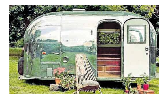
Practica el glamping o lo que es lo mismo, acampar con elegancia y estilo. Convivir con la naturaleza en condiciones de máximo lujo.