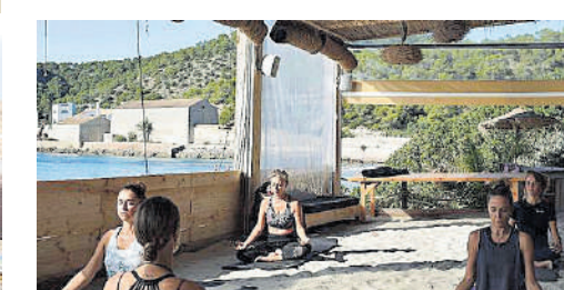
Primer retiro en Ibiza organizado por @Onlyonelifelbz del 6 al 8 de noviembre con yoga de la mano de @carolayoga y @mariely_bodyind , y el taller de crecimiento personal ‘Abre una ventana’ impartido por la orientadora @yolandaibz . Viaje de sonido, meditación guiada y fin de retiro en el yoga brunch de @besobeachibiza .