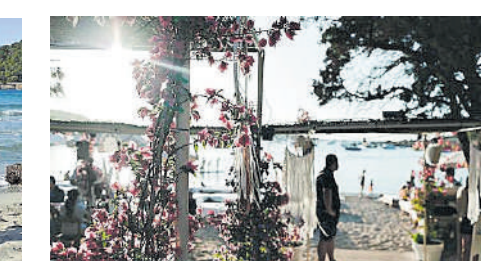
Desde este fin de semana ya se puede disfrutar todos los sábados de BOHO Islanders , el homenaje de Alma Beach a Ibiza. Una experiencia sensorial 360º en una localización perfecta.