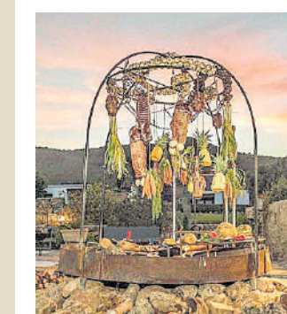
Escapada al hotel La Torre (Ibiza) con un descuento especial del 20% para personal sanitario. Las mejores vistas de sol de la isla y gastronomía de primer nivel.

La vida postconfinamiento y una pandemia que sigue azotando a la población están modificando nuestros hábitos . Crecen las propuestas de ocio al aire libre y las actividades seguras para toda la familia.