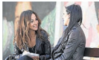
CARME BARCELÓ CRISTINA GONZÁLEZ FOTOS

del mundo -asegura-. Es genial, único. A veces nos cruzamos, nos saludamos... Los vemos a lo lejos cuando corren el pasillo”. Ese corredor es el que lleva a los campos de entrenamiento de la Ciutat Esportiva y el cruce de caminos de unas con otros. “Nos conocen, nos apoyan y nos valoran”, asegura Hermoso. Sabe que ellos van “a estar pendientes de nuestro partido de