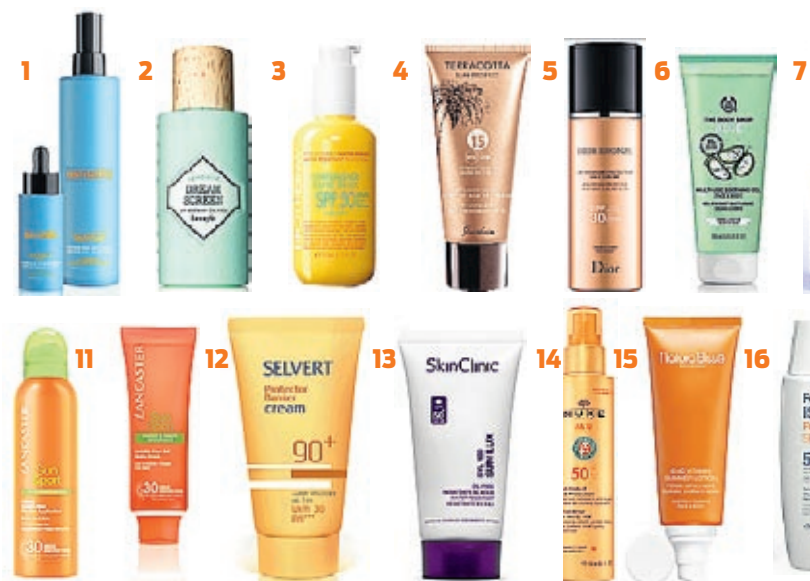
1. Aftersun corporal y facial de Sensilis 2. Protección 45, de Benefit 3. Resistente al agua, de Biotherm 4. Terracotta de The Body Shop 7. Alta protección en spray, de A-Derma 8. Previene las manchas, de Ducray 9. Refrescante, de deportistas, de Lancaster 12. Protección máxima para el rostro, de Selvert 13. Muy ligero, de Skin Clinic 14. Anti-estrías Ultraligero y especial para deportistas, de Isdin 17. Protector del cabello, de Klorane 18. Champú reparador, de René

completamente... combinación con... Los tratamientos... permiten eliminar... rostro sino también... luz pulsada para... activando así un... tivo, que corrige... El tratamiento n... derá de la extens... El láser resurfic ... léntigos, querato... para manchas q... láser ablativo, p... diario, pueden ap... que suelen dura... suave, con un to... El tratamiento ... do para paciente... y consiste en un... incluir láser, IPL... fórmulas magist... de la piel, aunqu... más uniforme, a... Este tratamiento