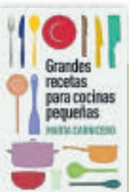
Grandes recetas para cocinas pequeñas M. Carnicero