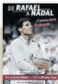
De Rafael a Nadal. A. García Muñiz y J. Méndez Vega

Este 23 de abril no estarán las calles llenas de rosas y libros pero eso no significa que perder el espíritu de Sant Jordi. Regala y regálate lectura que ahora puedes encontrar gratis o a muy buen precio on line.