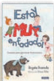
¡Estoy muy enfadado! Begoña Ibarrola