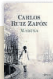
Marina Carlos Ruiz Zafón