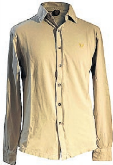
Camisa Polo de Avirex (89€)