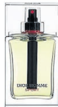
Dior Homme Sport The One Eau Toilette de Dolce & Gabbana (54€)

Luis Enrique, nuevo entrenador del Barça, tiene un estilo muy diferente al de su predecesor, el argentino Tata Martino. Más joven, más deportista, más moderno, el técnico asturiano encaja a la perfección con las nuevas propuestas para el verano de la firma Avirex. Por este motivo, desde SPORTSTYLE le ofrecemos al técnico blaugrana una serie de modelos estivales de la nueva temporada de Avirex. Una opción que ya siguen muchos jóvenes que quieren vestir cómodos o deportivos sin perder en ningún momento el estilo que representa Avirex. Las propuestas para Luis Enrique sirven también para todos aquellos lectores que se sienten identificados con esta manera juvenil e informal, pero de calidad, de vestirse durante todo el año.