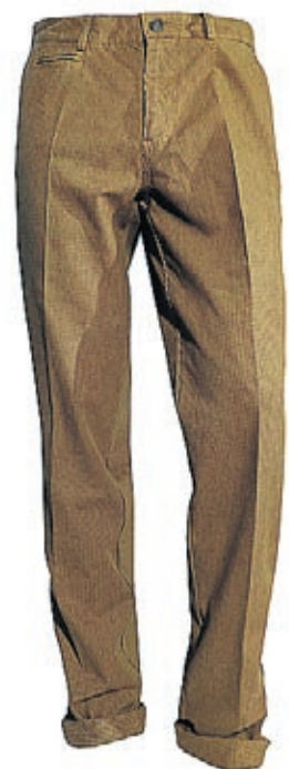
Pantalones Millenium 'Quadretto' de Avirex (139€)