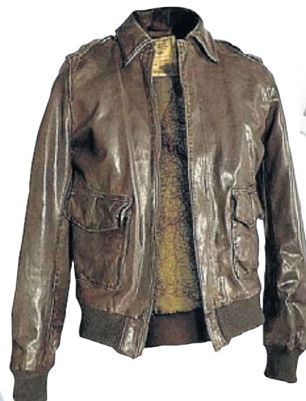
G1 Bomber de verano de Avirex (590€)