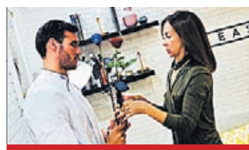
CARME BARCELÓ XAVIER ROVIRA FOTOS

D oble campeón olímpico y tres veces campeón del mundo de piragüismo, la vida de Saúl Craviotto dio un giro de 180 grados cuando ganó el concurso MasterChef. “No había hecho una tortilla en mi vida y me metí en un berengenal impresionante”, reconoce riendo mientras recoge los utensilios con los que acaba de cocinar ese mediodía en Alimentaria. En su móvil, muy activo el grupo de Whatsapp que tienen los 12 concursantes y que se llama ‘Sabooor’, palabra fetiche de su com-